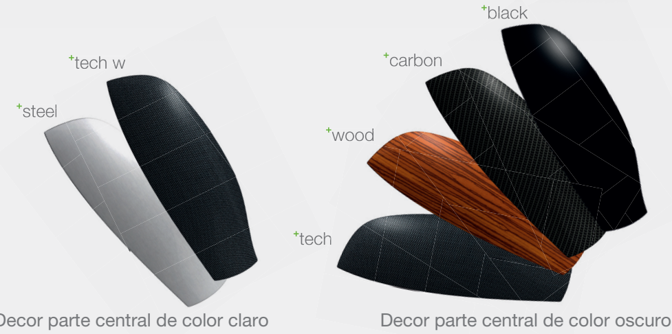
Decor parte central de color claro

Usted entra en un cuarto de baño y siente un ambiente acogedor – hay un fresco perfume en el aire; el diseño de la grifería y de los dispensadores se integra en el entorno. Con XIBU regala a los clientes y a si mismo estos momentos agradables. Usted elige los grifos y las decoraciones adecuadas a su cuarto de baño. Ofrezca a sus clientes y a si mismo la última generación de dispensadores higiénicos!