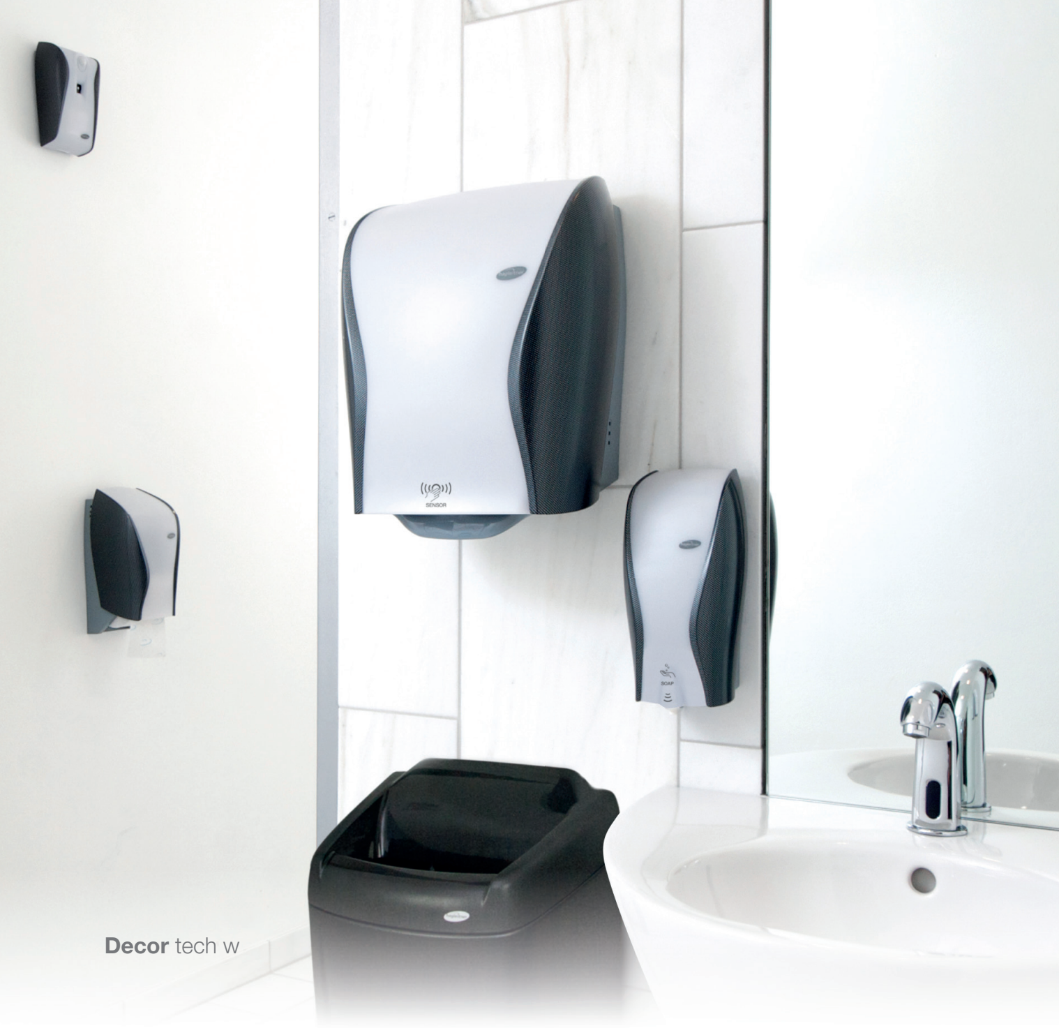
Decor tech w