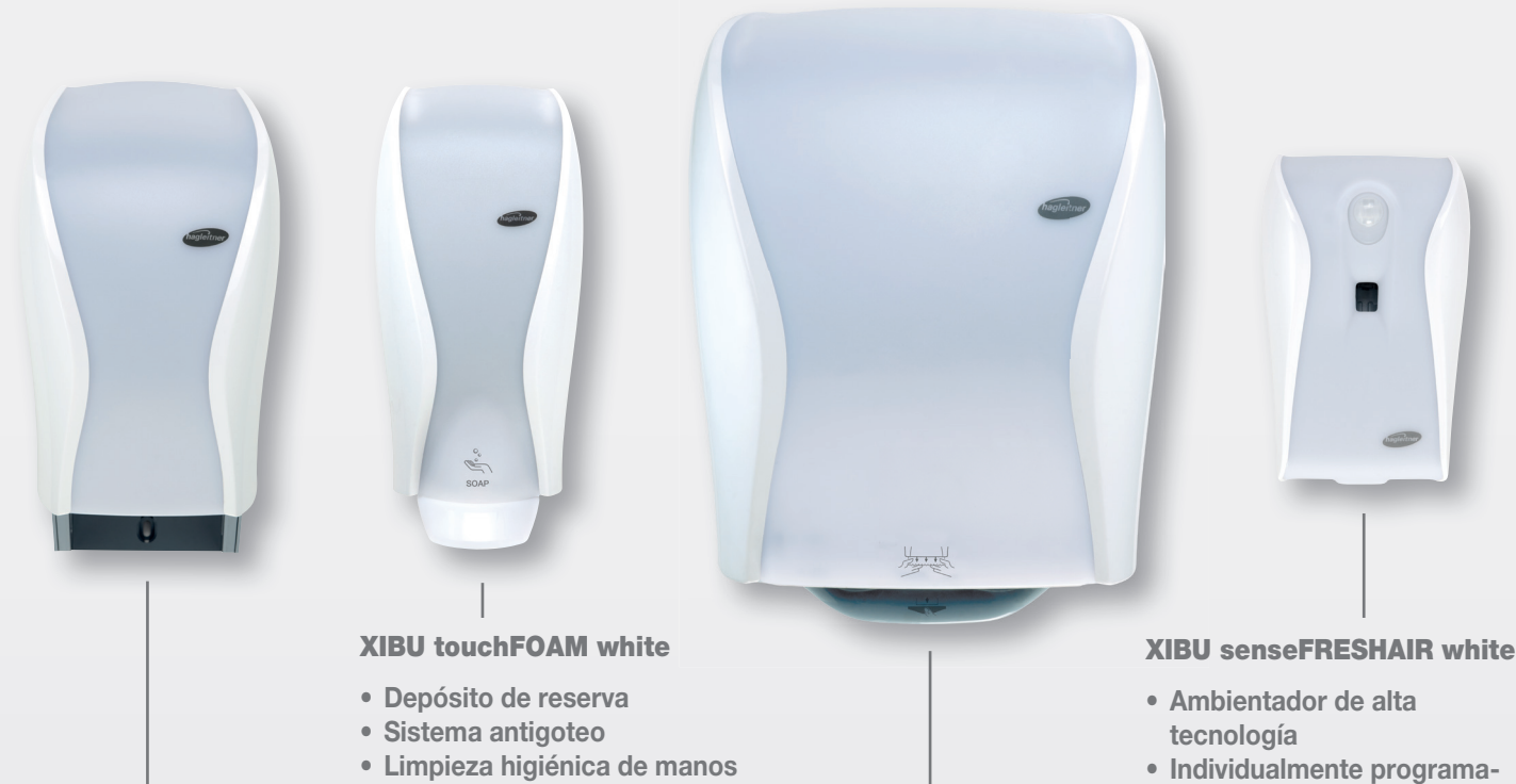
XIBU touchFOAM white